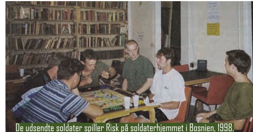
De udsendte soldater spiller Risk på soldaterhjemmet i Bosnien, 1998.