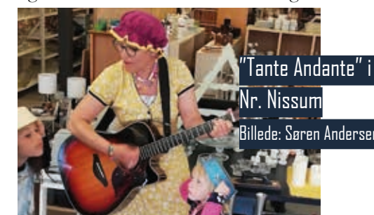
"Tante Andante" i Nr. Nissum

I uge 27 var der igen i år veteransommerlejr arrangeret af KFUM's Soldaterhjem i Aalborg i samarbejde med andre veteranorganisationer. Der var 43 deltagere og 11 frivillige hjælpere i Tranum i Nordjylland. Igen blev det en rigtig god uge hvor veteranfamilier fik et pusterum fra hverdagen og fik nye venskaber. Som ved tidligere år var der feltgudstjeneste, udflugter og masser af sommerferiestemning.