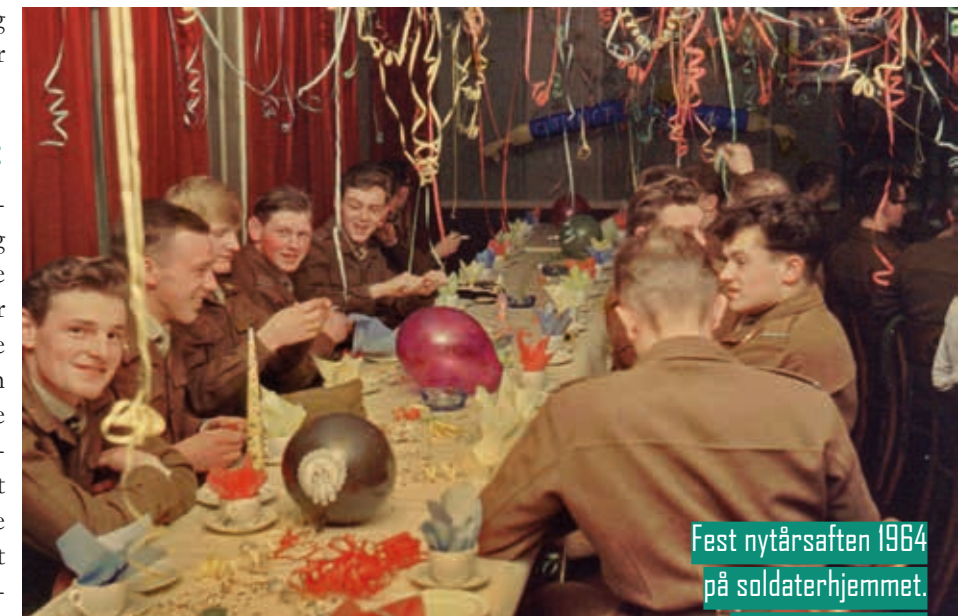
Fest nytårsaften 1964 på soldaterhjemmet.

Soldaterhjemmet i Haderslev bærer på en unik arv af fællesskab og støtte til soldaterne. Gennem 100 år har det været et hjem væk fra hjemmet og et trygt sted for soldaterne. Med sin historie om genopstandelse og frivillig indsats har soldaterhjemmet overvundet mange udfordringer og fortsætter med at være et centralt element i soldaternes liv i Haderslev. Det fejres med en jubilæumsfest den 15. september på soldaterhjemmet i Haderslev.