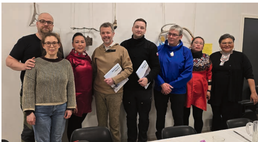
Det var en stor dag, da H. M. Kong Frederik gæstede KFUM's Soldaterhjem. Her er kongen sammen med soldaterhjemslederne, bygdebestyrelsen og formanden for Grønlands regering.