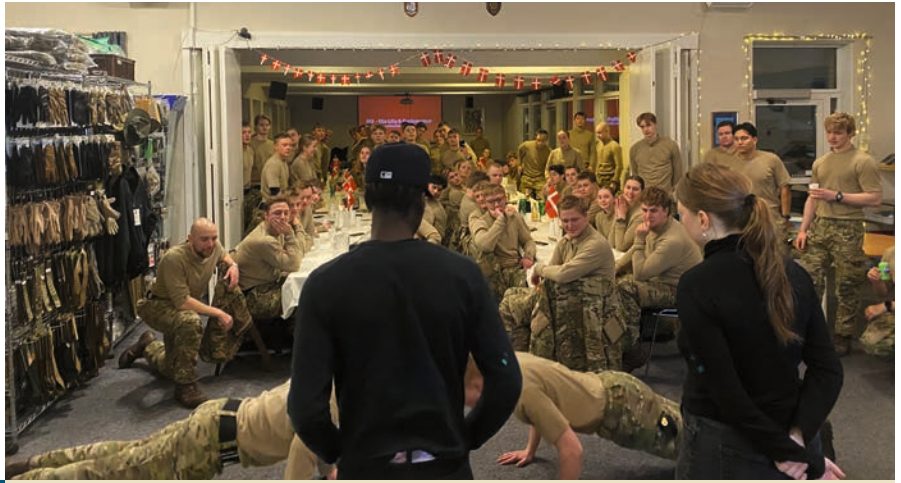
På soldaterhjemmet kan man slappe af. Når man har en god relation, bliver samtalerne også anderledes.